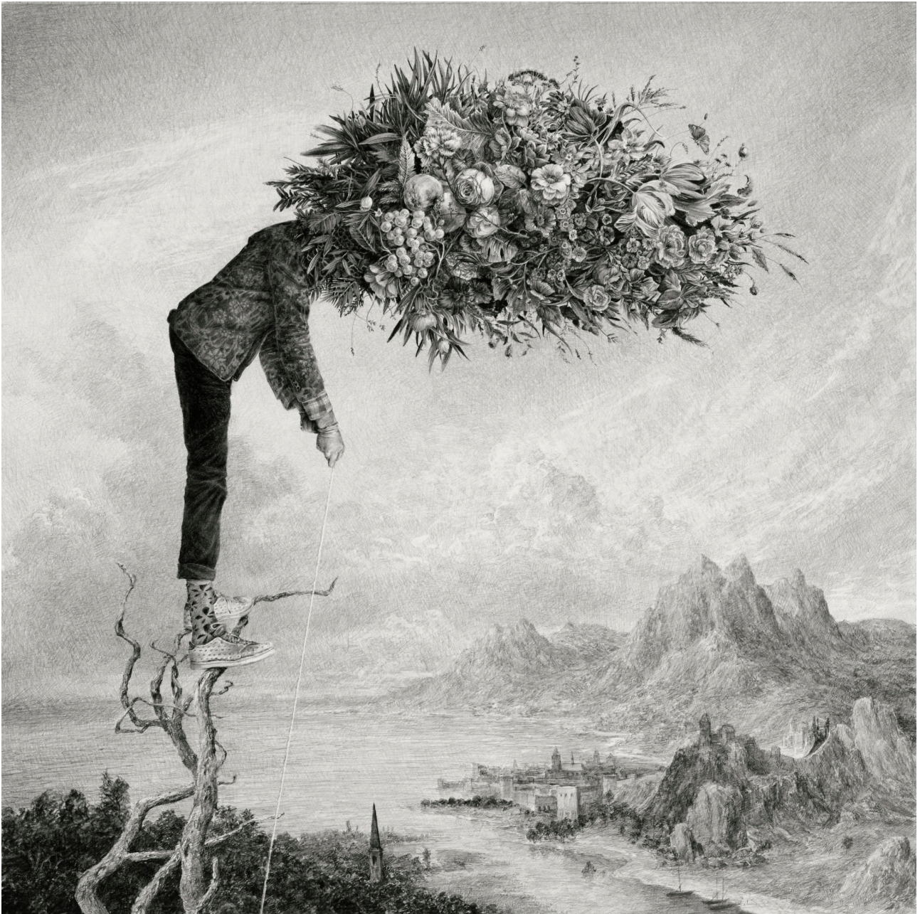
Ethan Murrow, The Gleaner , 2021, Graphite sur papier, 91 x 91 cm

https://www.fillesducalvaire.com/artiste/ethan-murrow/