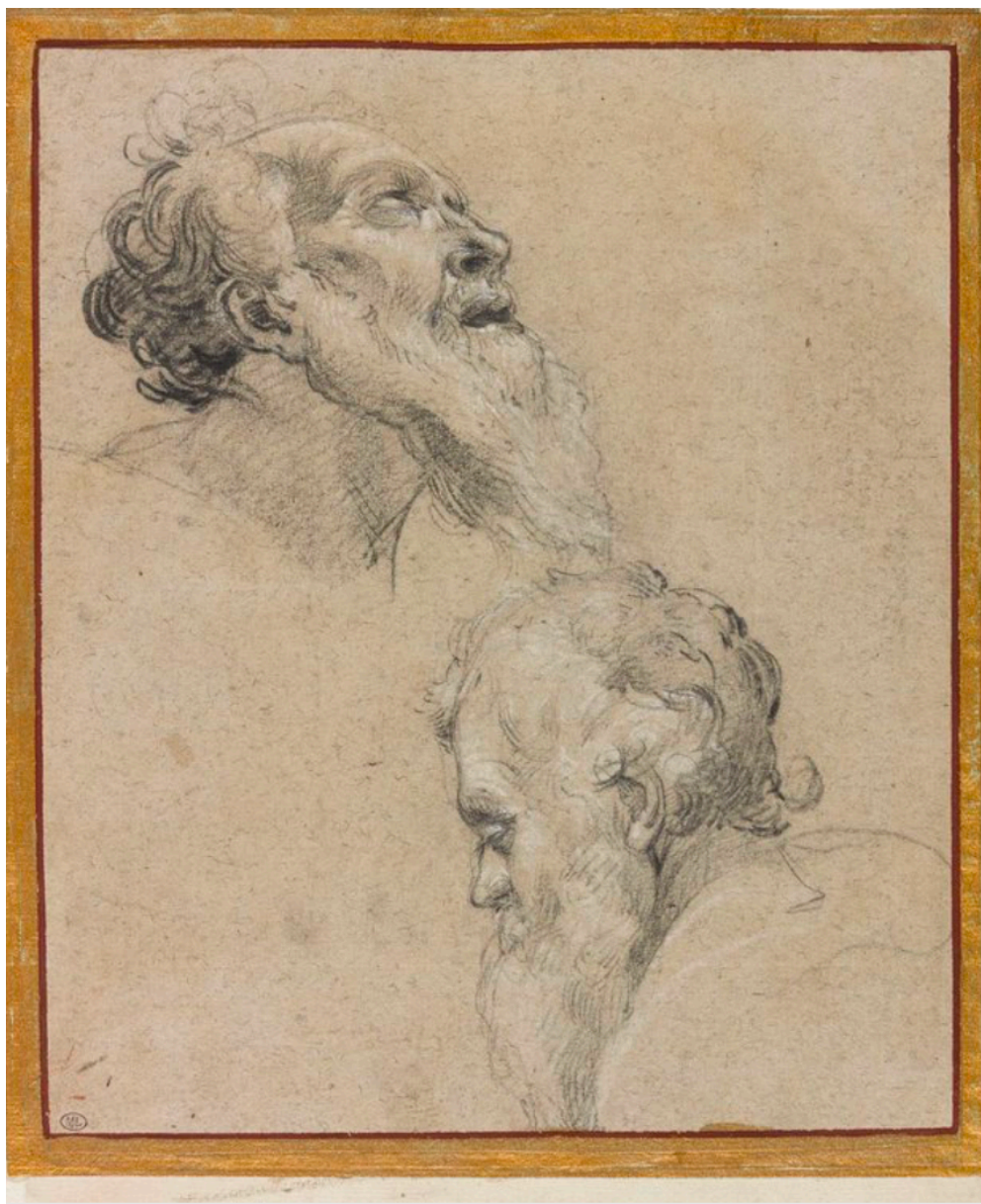
Autre perspective toujours avec Simon Vouet